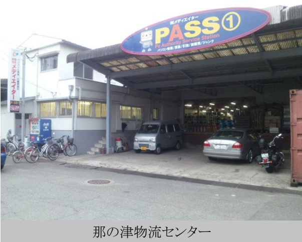
那の津物流センター